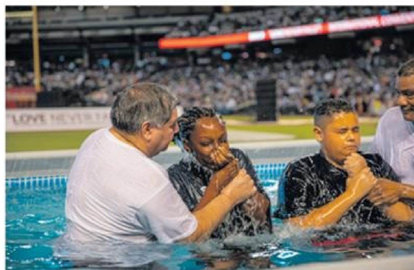
Un di e partinan mas anticipa di tur Congreso di Testigonan di Jehova ta e bautismo cu ta tuma luga ey mes, generalmente riba diasabra mainta. Na 2020, lo tin areglo haci localmente pa batisa tur candidato den un ambiente digno di e ocasion y na un manera safe. Lo stream e bautismo pa famia y amigo por wak.

Tur aña, cantidad di hende cu no ta testigo di Jehova ta asisti na e congresonan anual. Actualmente, tin mas di 8,6 miyon testigo di Jehova activo rond mundo. Toch, na 2019, e asistencia maximo di e congresonan a pasa 14 miyon. Y awor cu e congreso ta disponibel online den centenar di diferente idioma, kisas esaki lo bira e congreso di testigonan di Jehova cu e asistencia di mas halto den historia.